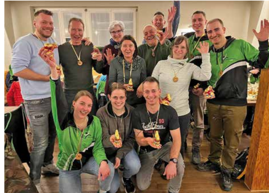
Die Leaderday-Crew des SATUS Gränichen.