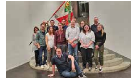
Die verdankten und geehrten Mitglieder für das Vereinsjahr 2022.

Der SATUS Lostorf blickt nun auf das nächste Vereinsjahr und freut sich darauf, neue Gesichter in der Turnhalle oder an den Vereinsanlässen begrüssen zu dürfen.