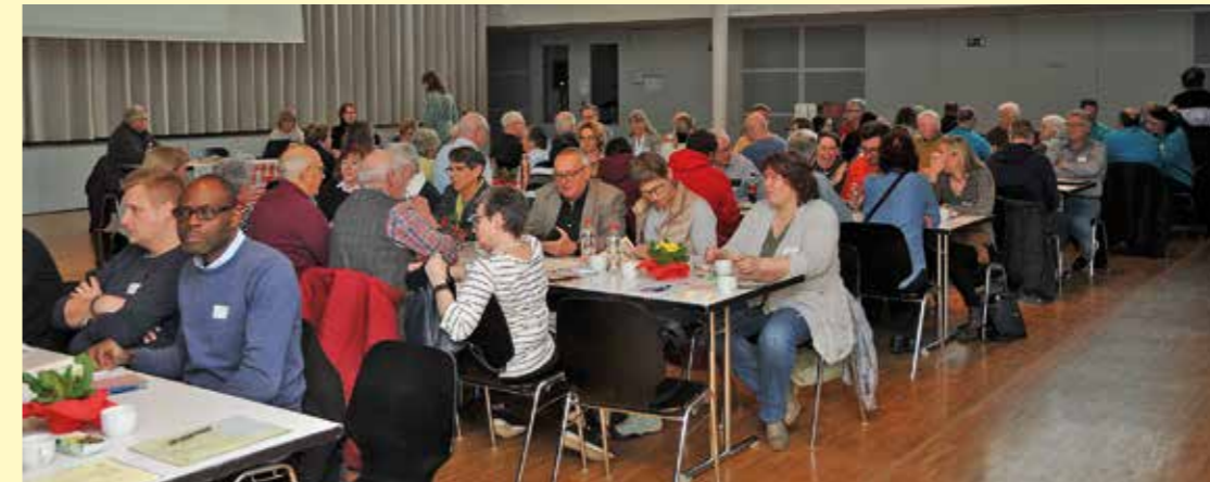
Gespanntes Warten auf den Versammlungsbeginn.