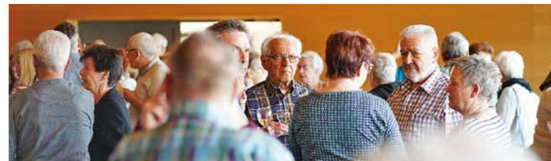
Wichtig an einer Veteranentagung, der Gedanken-austausch.

Text: Larissa Vock