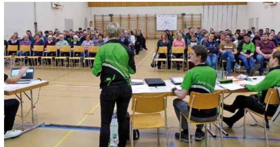
Volle Halle an der Generalversammlung