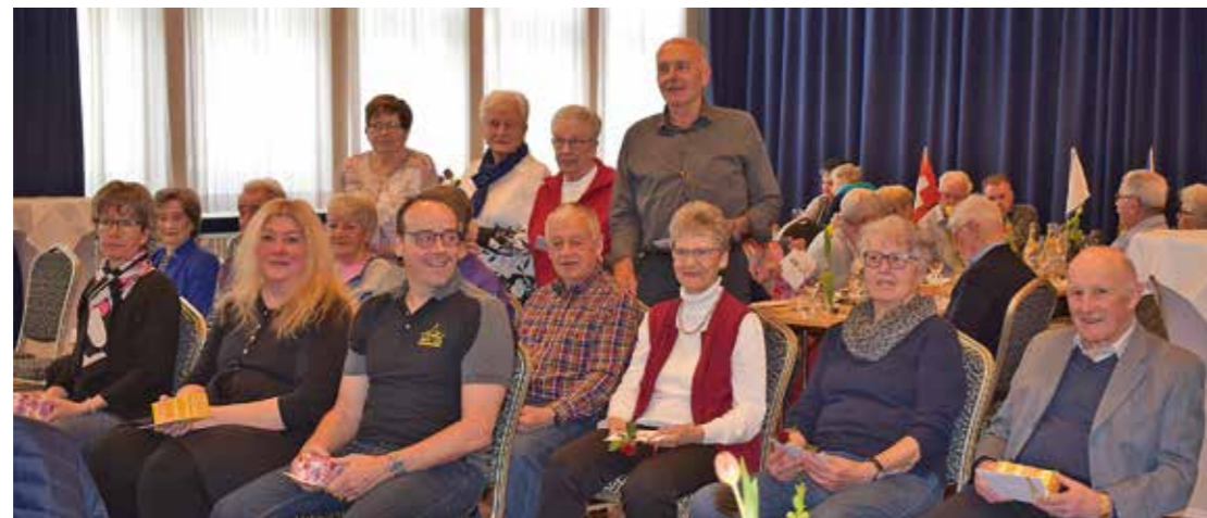
Die Geehrten stellen sich dem Fotografen.