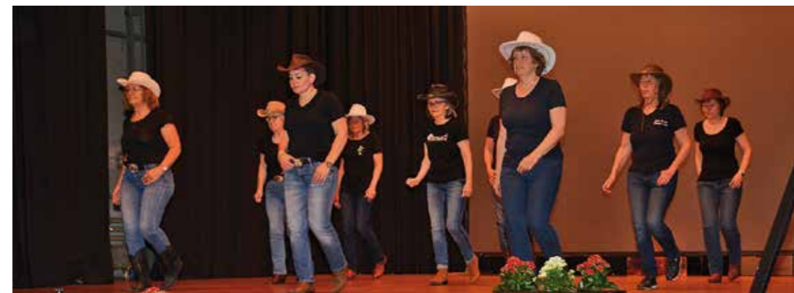
Vorführung der Line-Dance-Gruppe.

Text: Ueli Steuri; Fotos: Vreni und Ueli Steuri