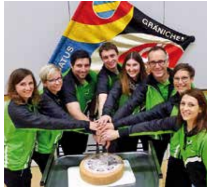
Der Vorstand schneidet den selbstgemachten Käse an.