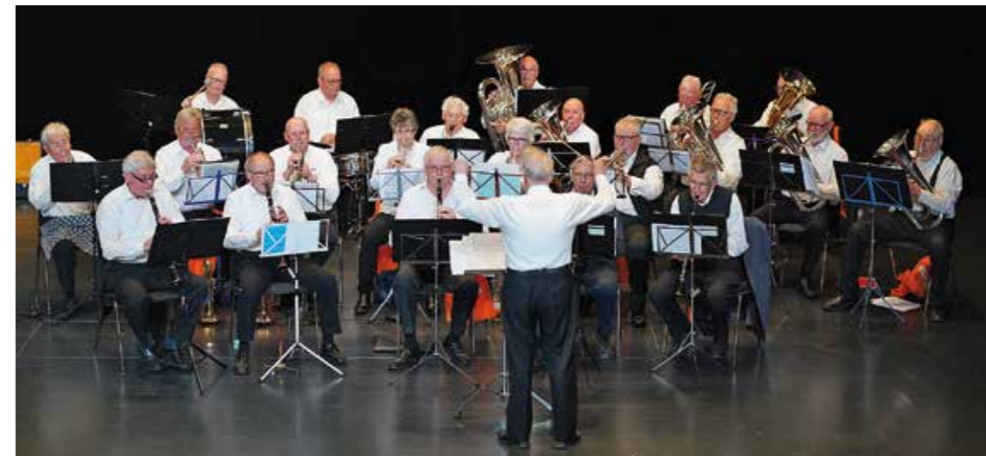
Musikalischer Auftakt durch die Seniorenmusik Möriken-Wildegg.

Am 23. April 2023 fand im Gemeindesaal in Möriken die SATUS-Veteranentagung des Kreis NWZS statt. Mit Kaffee und Zopf begrüßte der SATUS Möriken-Wildegg die 84 Veteraninnen und Veteranen. Die Seniorenmusik von Möriken-Wildegg sorgte dabei für die musikalische Umrahmung.