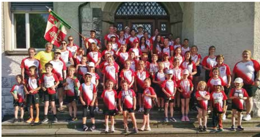
Rückkehr vom Jugendsporttag in Gümligen

Unsere Athletinnen und Athleten haben hervorragende Ergebnisse erzielt. Egal ob Kids-Cup, Meetings oder kantonale LA-Meisterschaften, meistens waren unsere Sportler vorne dabei.