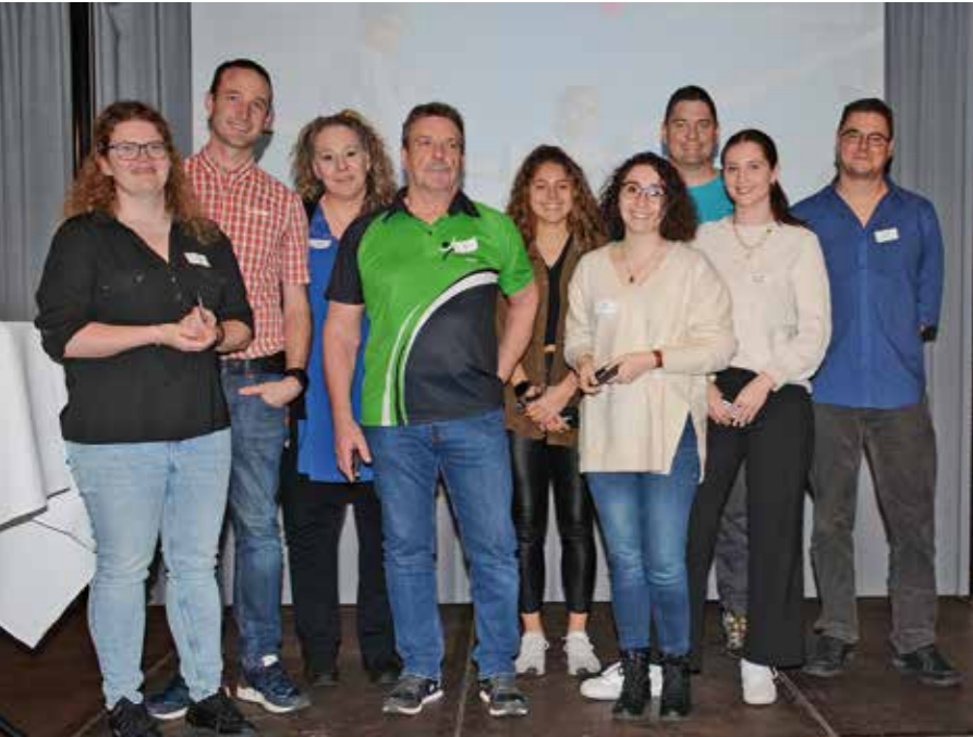
Gewinnerinnen und Gewinner des «Spirit of Sport Challenge App».